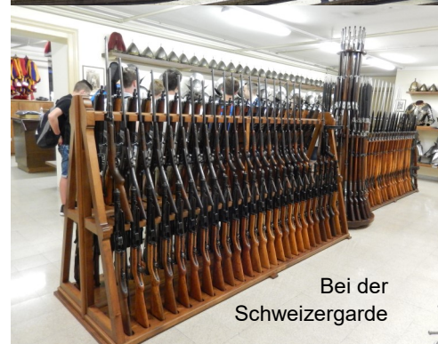
Bei der Schweizergarde